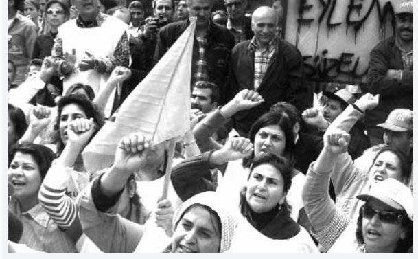
Emekçi kadınlara çalışma koşulları ve 1 Mayıs üzerine düşüncelerini sorduk...

- Çalışma koşullarınızdan bahsedebilir misiniz?