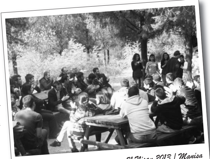
21 Nisan 2013 | Manisa

Sabah saatlerinde piknik alanına varılmasıyla beraber ortak kahvaltı sofrası kuruldu. Kahvaltıdan önce Buca BDSP adına açılış konuşması yapıldı. Kahvaltının ardından verilen arada Bucalı işçi ve emekçiler bağlama ve gitar eşliğinde türkü ve marşlar söylediler. Akşam saatlerinde kurulan sofranın ardından 1 Mayıs forumu