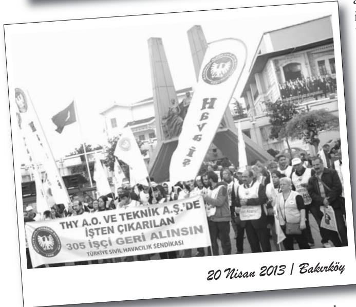
20 Nisan 2013 | Bakırköy

Sermaye hayatı zindan ettiği emekçilerden, gün geçtikçe tepkiler almaya devam ediyor. Ekonomik ve demokratik talepleri için eylemler gerçekleştiren emekçiler, haklarının peşinde olacaklarını dile getiriyorlar.