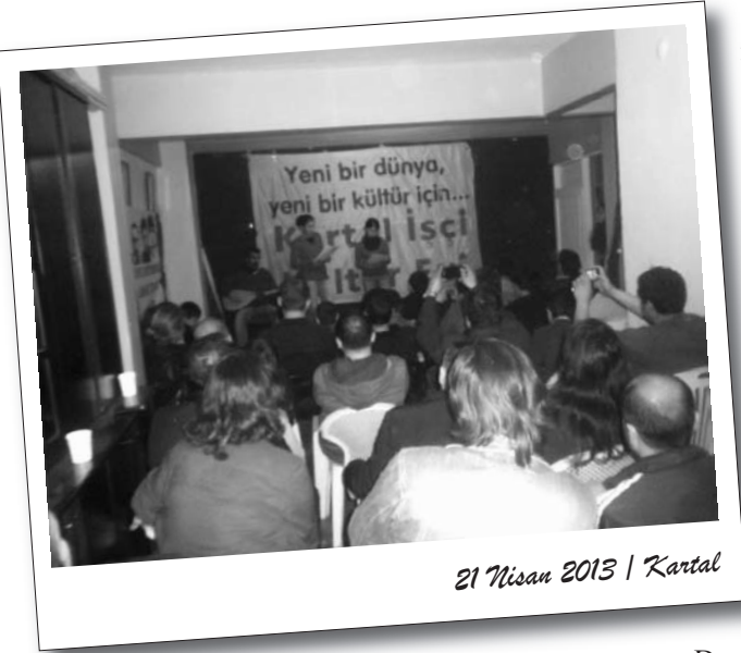
21 Nisan 2013 | Kartal