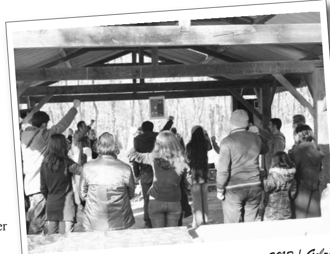
21 Nisan 2013 | Gebze

Kızıl Bayrak / Kartal-GOP-Küçükçekmece-Gebze- Buca- Manisa