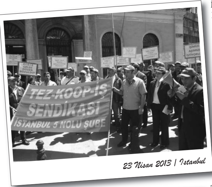
23 Nisan 2013 | İstanbul